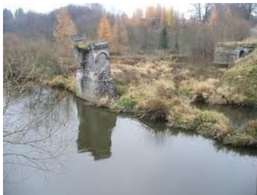
Pozostałości po moście

bunkrów ukrytych w pobliskim lesie i okolicznych polach. Do dnia dzisiejszego Bardyny odwiedzają poszukiwacze skarbów, mając nadzieję znalezienia „pozostałości wojennych”.